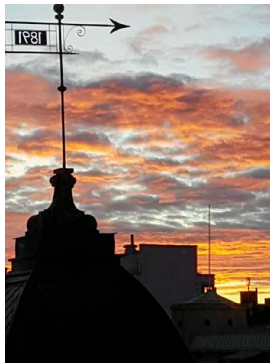
Solnedgång över stan.