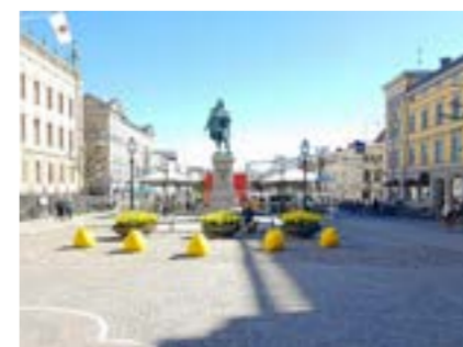
Påsk på Stortorget 2019.