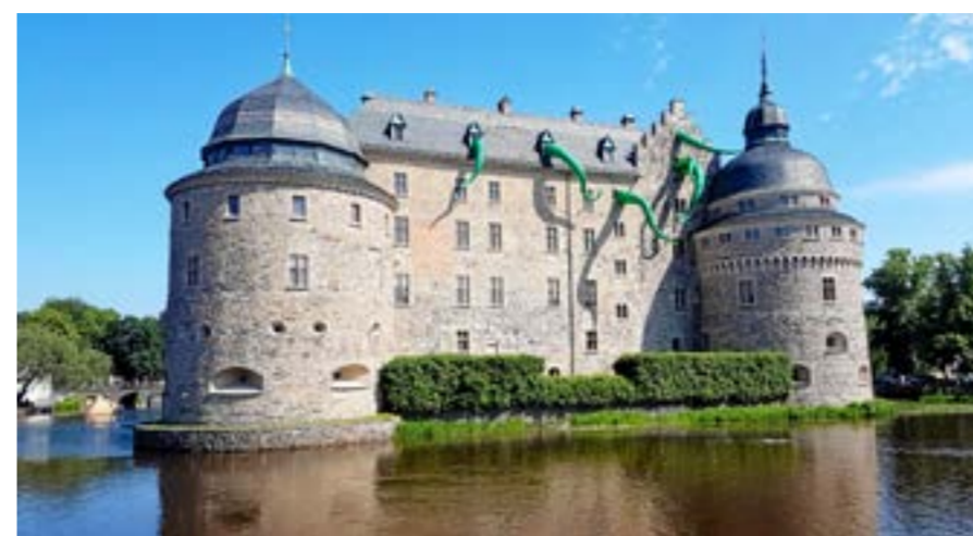
Open Art på Slottet 2019. Octopus Attack.